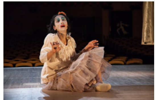
Takao Kawaguchi—About Kazuo Ohno

2013년의 초연 이래 세계 38도시에서 상연하여, 2016년에는 벅시상에도 후보로 올랐던 가와구치 다카오 [오노 카즈오에 대하여]를, 8년만에 도쿄에서 재연. 전설적 부토가인 오노 카즈오에 대하여, 한편으로는 그 움직임을 기록 영상으로부터 [완전히 복사]하는 것으로 충실히 재현하고 다른 한편으로는 그 세계관의 대담한 재해석을 시험하는 화제작을, 영상만의 연출로 전달한다.