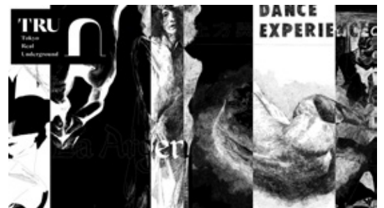
Illustrations: Yo Isehaus

연표작성협력, 기고 : 노리코시 다카오 (작가, 야사구레 부토 평론가) 일러스트 : 이시하라 요우 (화가)