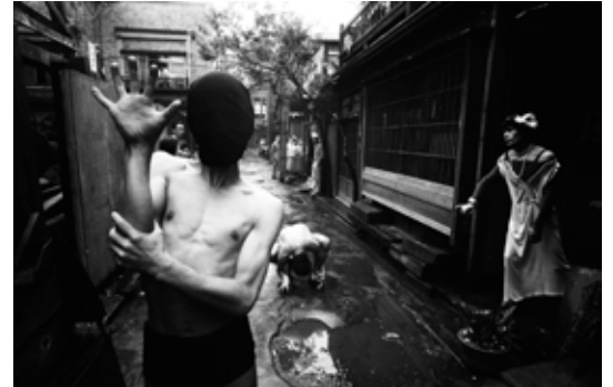
William Klein 'Crab Dancer' ©William Klein, Tokyo 1961

1961년에 처음 내일한 사진가 윌리엄 클라인은, 약 2개월간 도쿄의 거리를 돌아다니며 촬영하여, 64년에 사진집 [도쿄]를 발표하였다. 그 중 긴자를 담은 작품 10점을 선별하여 전시한다. 올림픽을 앞두고 혼란과 광기에 둘러싸인 도시를 세계적 사진가의 눈은 어떻게 파악했을까. 일상의 풍경에 돌연 60년전의 정경이 나타나는 도시형의 사진전이다.