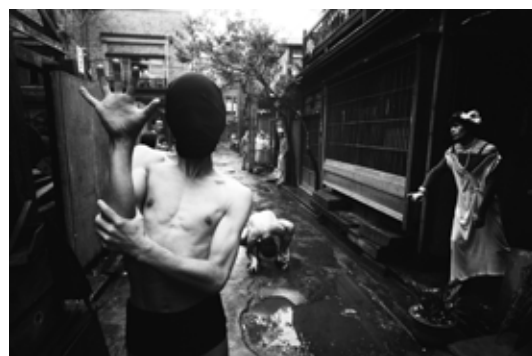
William Klein「Crab Dancer」©William Klein, Tokyo 1961