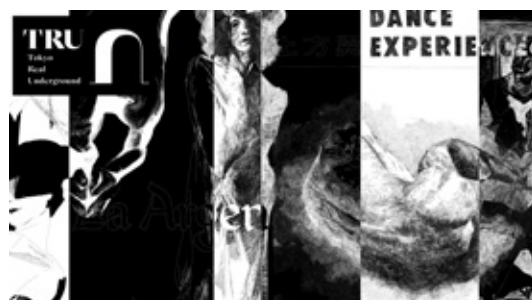
线上年表《舞蹈大事记》插画: 石原叶